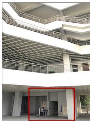
南棟1樓搭電梯上樓 (外觀白色階梯建築)